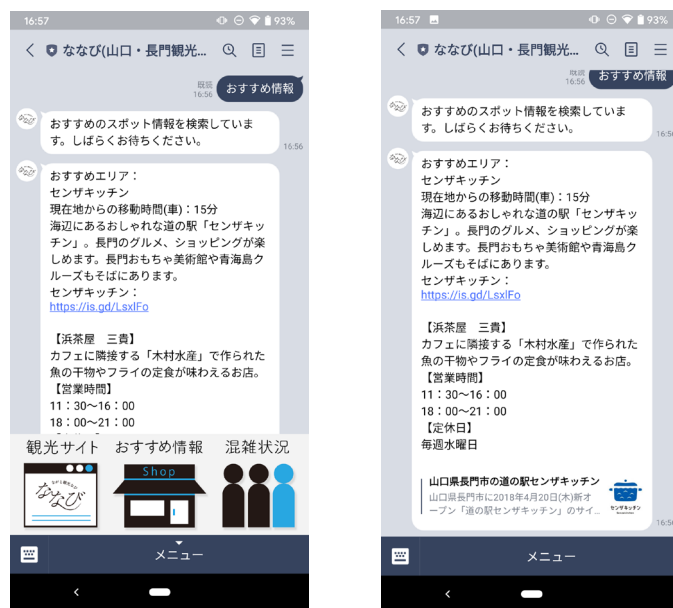
プッシュ配信されるメッセージのイメージ

(*)「ながとフリーWi-Fi」は、事前のアンケート回答など簡単な手続きのみで長門市内で利用できるフリーWi-Fi サービスです。