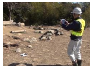
<対空標識の設置確認>

また、遠隔地にいる管理者が現場の作業状況を即時に把握できるリアルタイム情報共有機能や、フライト実施後のレポート作成を支援する機能も有しています。これらの機能を、日立システムズのクラウドで提供いたします。