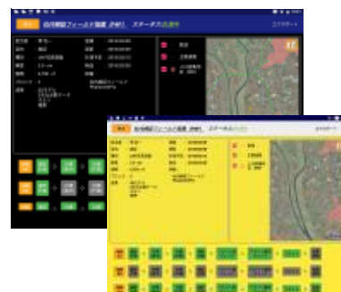
<タブレット画面例>