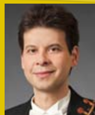
ヘクター・ファルコン (ヴァイオリン)

演奏/ニューヨーク・シンフォニック・アンサンブル ソリスト/ベンジャミン・バロン (クラリネット)