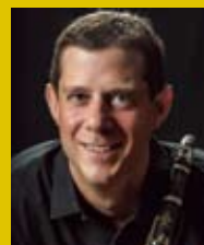
ベンジャミン・バロン (クラリネット)

演奏/ニューヨーク・シンフォニック・アンサンブル ソリスト/ベンジャミン・バロン (クラリネット)