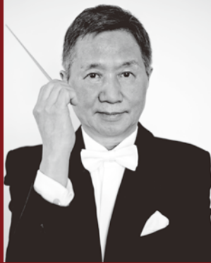
音楽監督兼常任指揮者