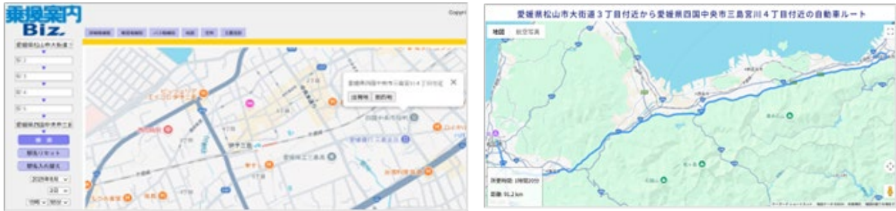
自動車経路検索連携機能の画面イメージ