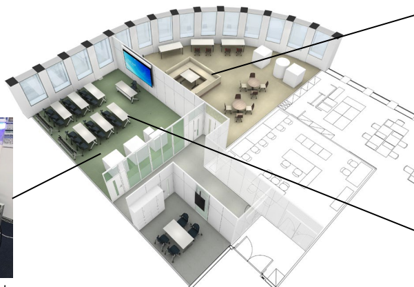
DSL Osaka フロアイメージ