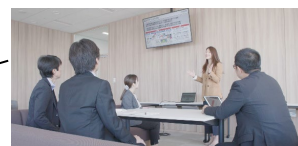
お客さまとのオープンイノベーションの場