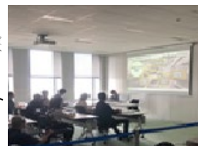
教育やセミナーの実施