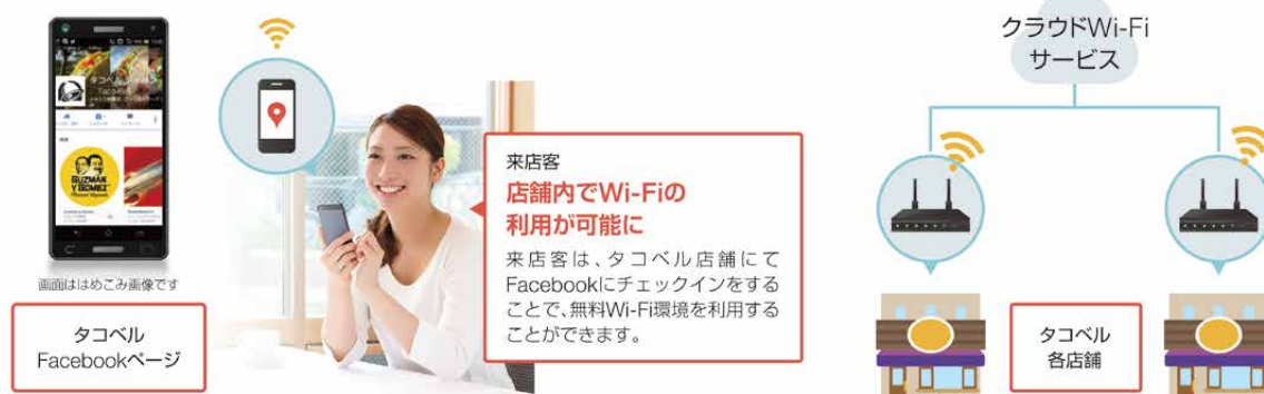
タコベルへの「クラウドWi-Fiサービス」利用イメージ

タコベルは、1962年にアメリカ合衆国(以下、米国)のカリフォルニア州で創業して以来、米国を中心に世界で約 7,000 店舗を展開しているメキシカン・ファストフードチェーンです。日本ではアスラポート・ダイニングが経営を担い、2015年4月から店舗展開を開始しています。タコベルは、日本での店舗展開にあたり、来店客へのサービス向上や認知度向上に向けたSNSの活用などを目的に、Wi-Fiサービスの導入を検討しました。導入にあたっては、初期投資を抑えつつ将来の急速な店舗拡大にも柔軟に対応できること、IT担当者や店舗スタッフに管理負担がかからないこと、国籍を問わず来店客が簡単に利用できることを選定の条件にしました。