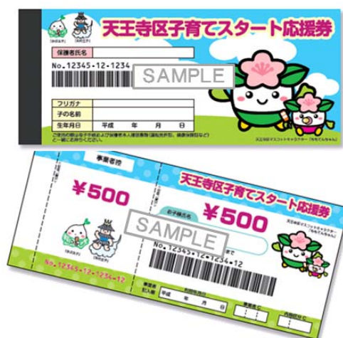
天王寺区子育てスタート応援券イメージ

「天王寺区子育てスタート応援券」は、2014年4月1日以降に出生した、天王寺区に住民票を有する3か月児健康診査受診者を持つ家庭を対象に、子どもの体験・教育等の機会を提供するサービス、子どもを預かるサービス、産後の育児・家事支援など養育者を支援するサービス、任意予防接種に利用できるバウチャー券です。対象となる住民の交付申請書(はがき)による申請に基づき1万円分交付され、お子様が2歳の誕生日になるまで利用できます。応援券の利用先は、「天王寺区子育てスタート応援事業者」のステッカーを掲示している施設・店舗であれば、利用者が好きなサービスを選んで利用できます。